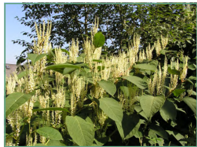
japán keserűfűfélék/ rod pohánkovec (krídlatka)