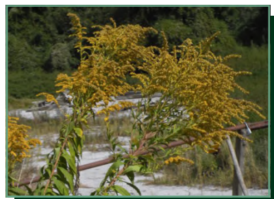
kanadai aranyvessző/ zlatobyľ kanadská