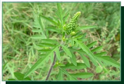
parlagfű/ ambrozia palinolistá

Inváziós növényfajok kiirtására vonatkozó kötelezettség Nagyszarva község területén Povinnosť odstraňovať inváznych druhov rastlín na území obce Rohovce