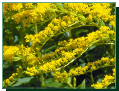
magas aranyvessző/ zlatobyľ obrovská