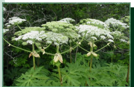
kaukázusi medvetalp/ bolševník obrovský