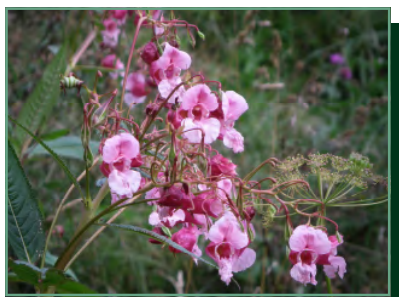
bíbor nebáncsvirág/ netýkavka žliazkatá