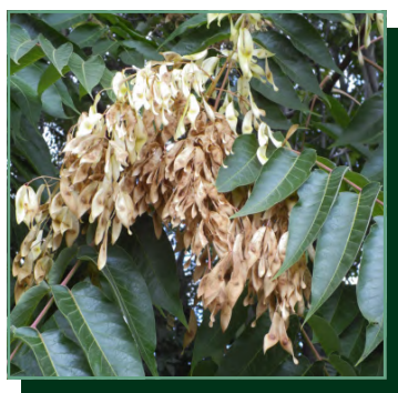
mirigyes bálványfa/ pajaseň žliazkatý