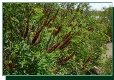
gyalogakác /beztvarec krovitý