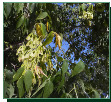
kőrislevelű juhar/ javorovec jaseňolistý