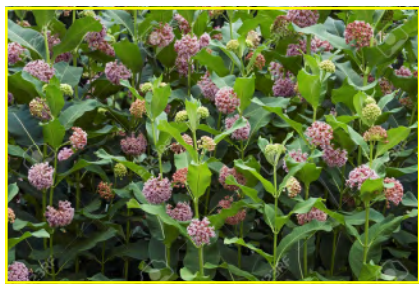
selyemkóró/ glejovka americká